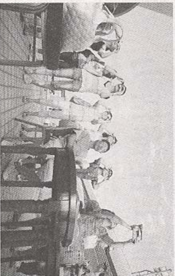
↑ 美国专家利用专业仪器观测日全食。渭南市全食观测区市民在